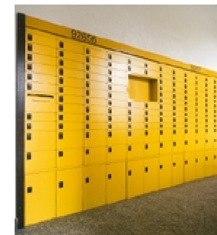
Schließfächer Klassik Typ 1404