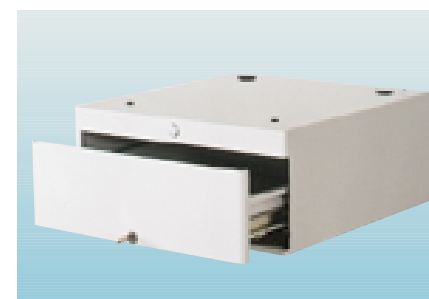
Kassenlade Typ 1402