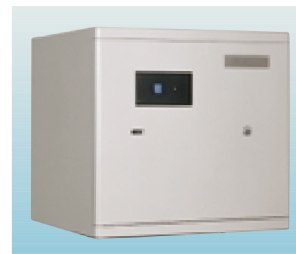
Abwurfwertglass Typ 1401